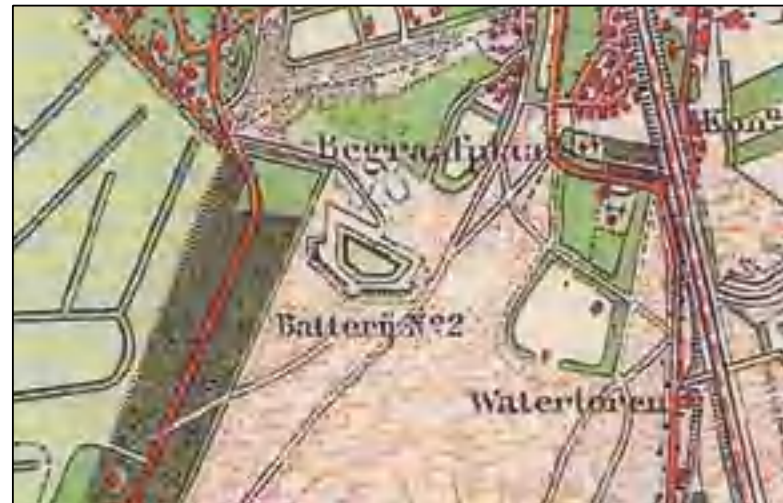
Batterij no 2 met links de Nieuwe 's Gravelandseweg omstreeks 1905 (Grote Historische topografische Atlas. Uitg. Nieuwland 2005)