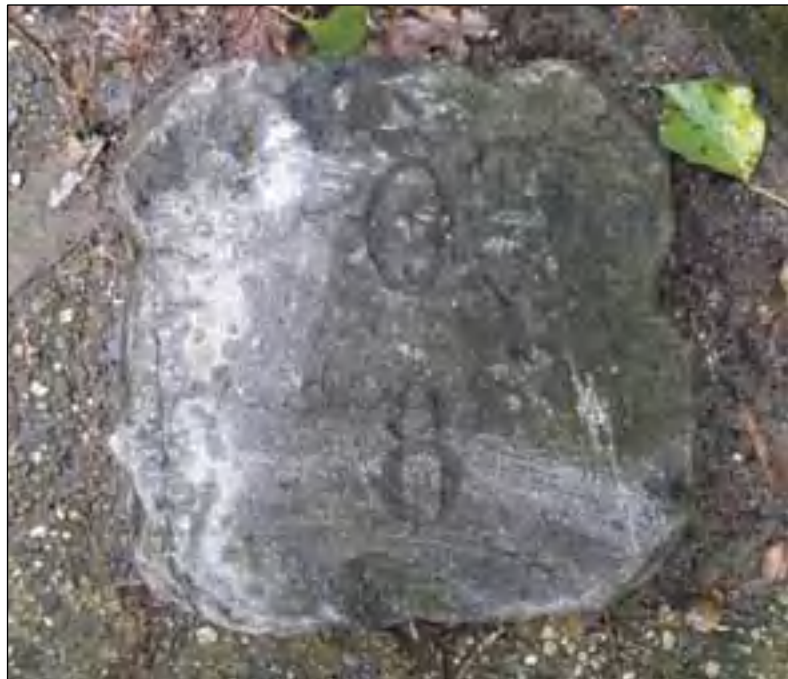
Paal O8.

TEKST: KLAAS OOSTEROM MET DANK AAN HENNY VAN RENES EN JAAP VAN WELSEN