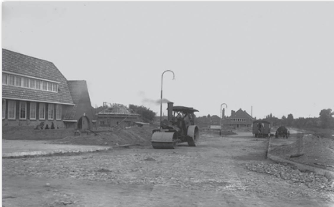
14 juni 1933. Dr. Frederik van Eedenweg. Tekst: Martin Heyne.