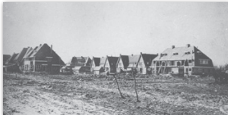
De 's Jacoblaan toont de achterkant van de huizen aan de Bellamylaan.