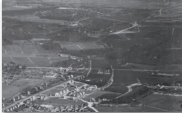
Luchtfoto uit 1925. De eerste villa's aan de Bilderdijkstraan en de Bellamylaan al klaar. Midden onder is de brug bij de Oud-Bussummerweg. Vanaf linksonder loopt de Brediusweg.

Karel de Bazel werd eind 1922 alsnog betrokken bij de stedenbouwkundige plannen van de gemeente voor de ontwikkeling van dit gebied. De toen al befaamde “bouwmeester” was in de arm genomen door één van de bewoners van de Brediusweg die bezwaar maakte tegen een ontwerp wegenplan van de hand van de gemeentearchitect. De Bazels inbreng in de bezwaarprocedure overtuigde burgemeester en wethouders van zijn visie en hem