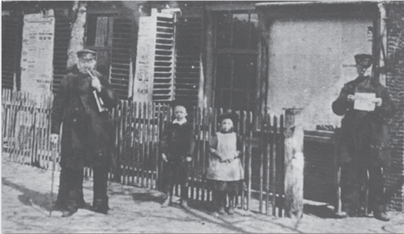
Officiële bekendmakingen werden op het raadhuisje aan de Brinklaan opgehangen.