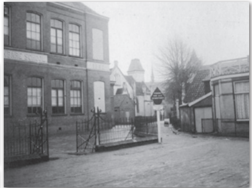
links de Willemschool aan de Landstraat. In het midden de Schoolstraat en op de achtergrond de Hervormde Kerk (vele jaren later t.v.-studio Irene)

Voor de arme kinderen van de Willemschool wordt ingezameld. O, kom er eens kijken op 5 december: in de school zijn 's middags het speelgoed en de kleren te bezichtigen die later aan de kinderen worden uitgedeeld.