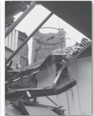
Gefotografeerd vanuit dit rechter gebouw is de schade -van de storm op 18 januari 2007- aan de schoorsteen en aan de dakconstructie zichtbaar.

(ontwikkeld bij de bouw van spoorbruggen) bood de mogelijkheid tot grote overspanningen en tot dan onmogelijke geachte draagvloeren. Bij de fabriek kwam een vrijstaand ketelhuis met schoorsteen.