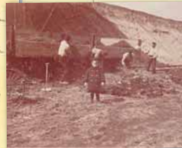
Een beeld van het werk in de zanderijen: de metershoge zandlaag wordt met de hand in schepen of op wagons geschept.

Met de komst van de werkverschaffing en de uitkeringen en het ontstaan van de arbeidersbouwverenigingen ontstond later een wat betere situatie.