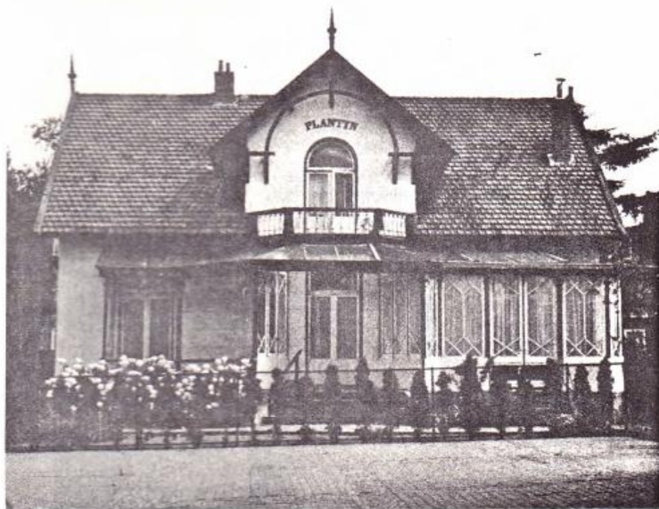
Huize „Plantyn“, waar o.a. het „diakonaal centrum“ is gevestigd.

" MESTVAALT TE KOOP : te zien bij villa Amalia".