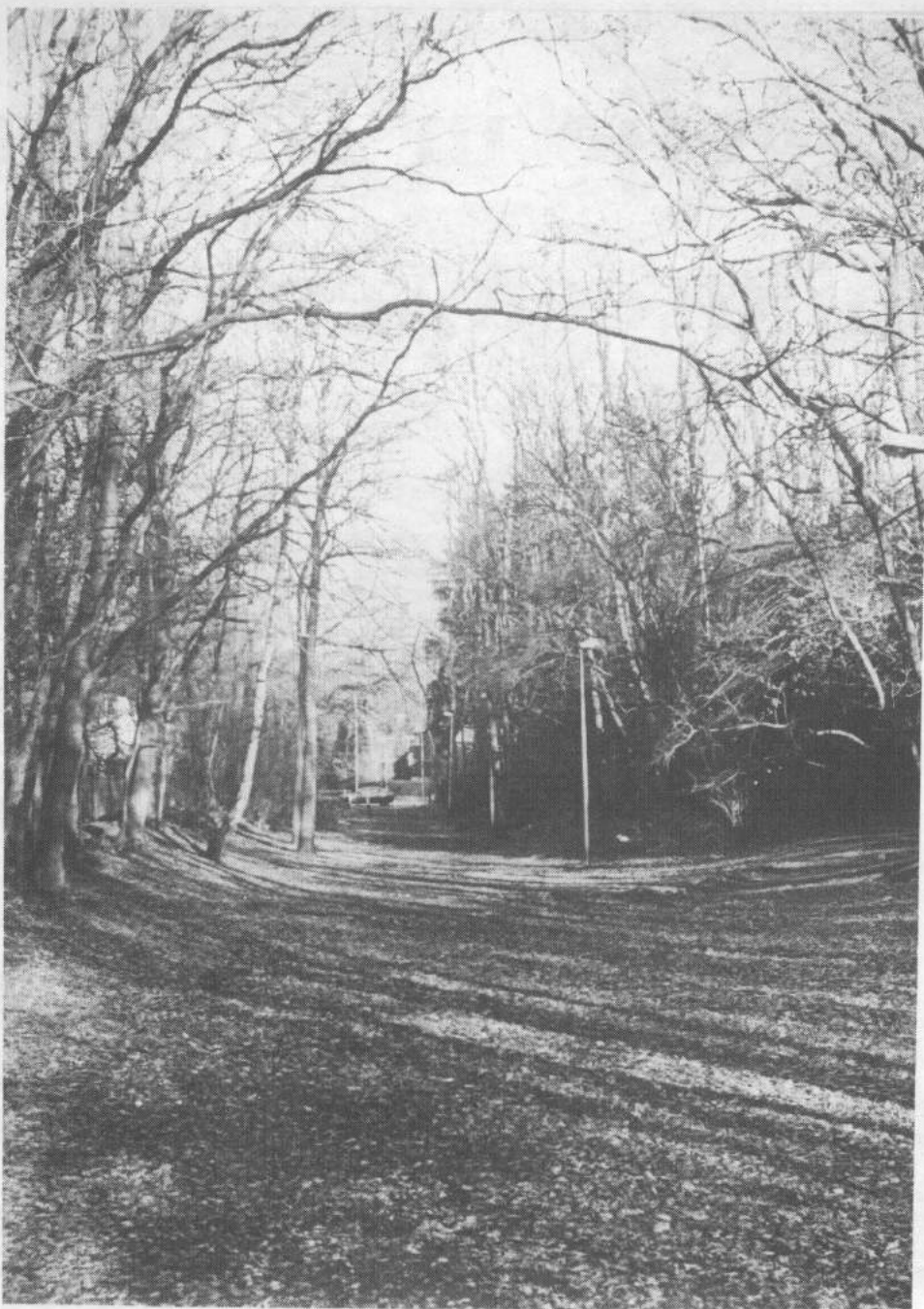
Het stukje van de Vosmaerlaan dat al eeuwen geleden als weg werd gebruikt. Duidelijk is te zien dat de weg in de loop der tijd is uitgesleten.