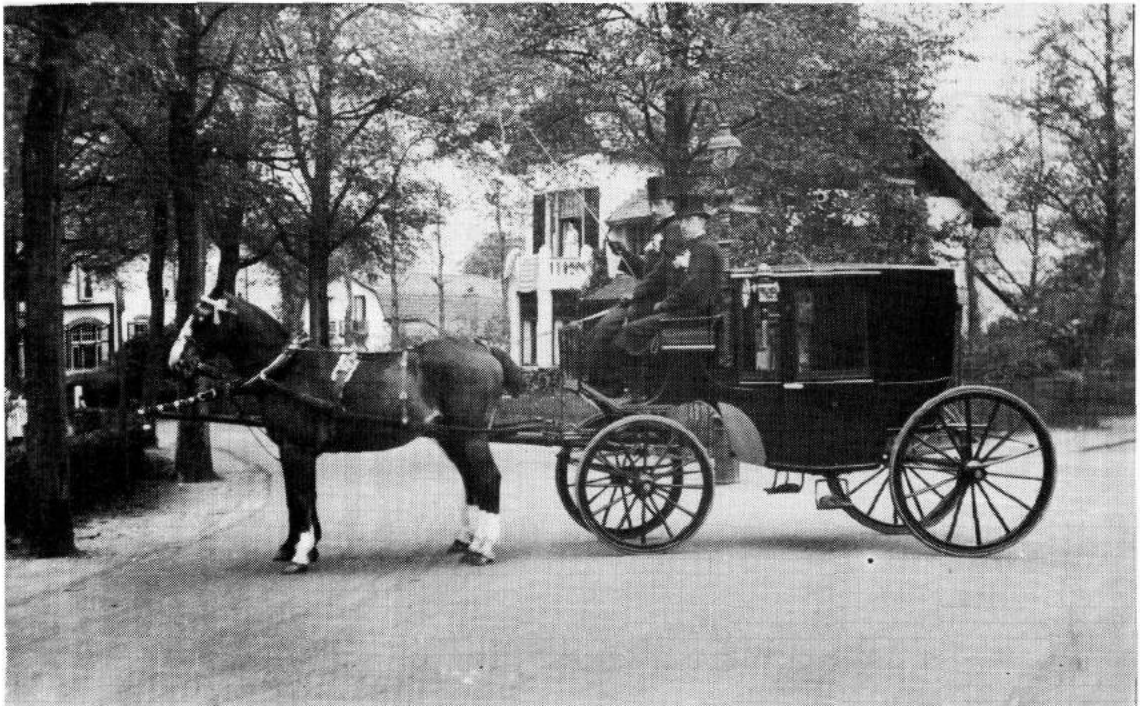
Trouwerij eerste klas; palfreniers : Henny en Teun Foto genomen op hoek Nwe Hilversumseweg/Spiegelstraat Paarden : Jopie en Gustaaf