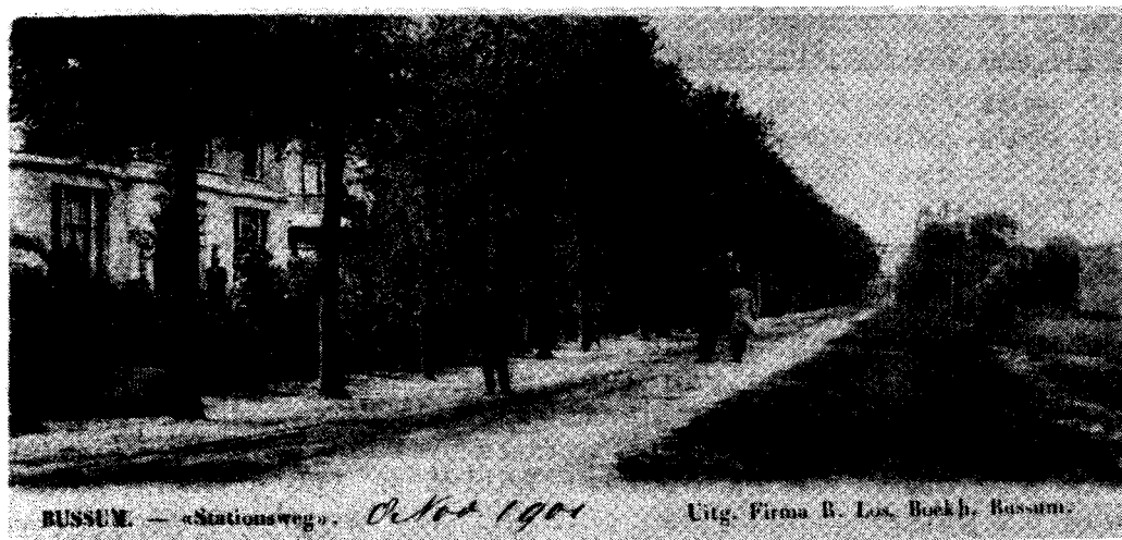
BUSSUM. — «Stationsweg». Oktober 1901