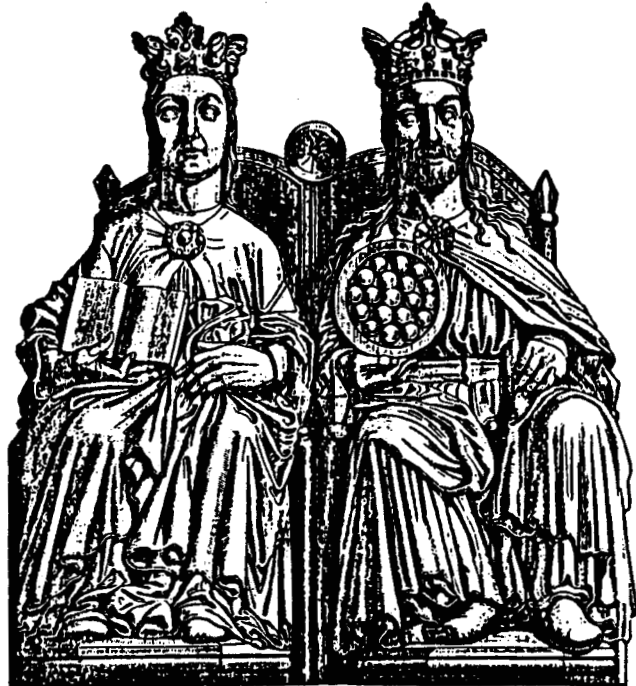
Keizer Otto I de Grote met zijn eerste gemalin Edith.