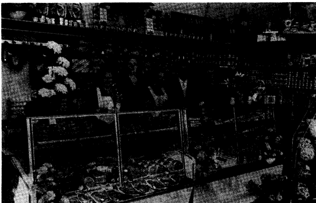
Foto: 1962 - Feestelijke heropening