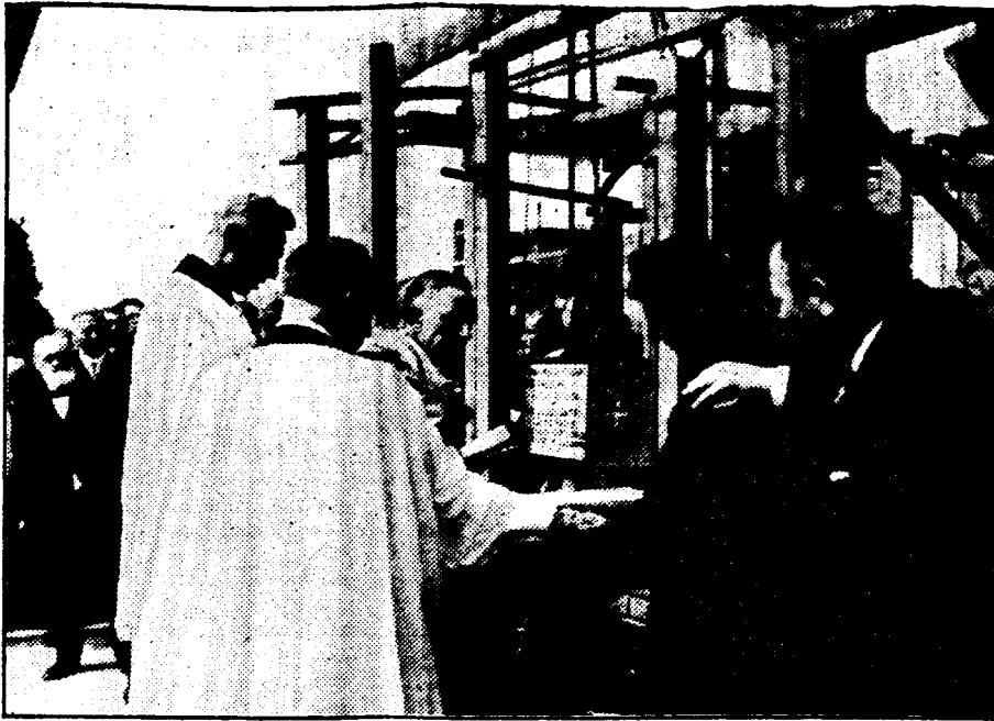
Het moment der hoeksteenlegging.

En nu 10 jaar later? Wie, behalve de zorgeloze naturen, gevoelt niet, dat wij wederom een tijdperk van de wereldhistorie hebben bereikt, hetwelk tot den hoogsten ernst stemt. Een tijdperk van economische depressie en daarmee gepaard gaande ontstellende werkloosheid, zooals wellicht eene eeuw lang de wereld niet geteisterd heeft, een tijdperk tevens, waarin ongeloof, ja sterker nog, openbare vijandschap en lastering tegen God en Zijn gelofde op de driestste wijze tot uiting komen.