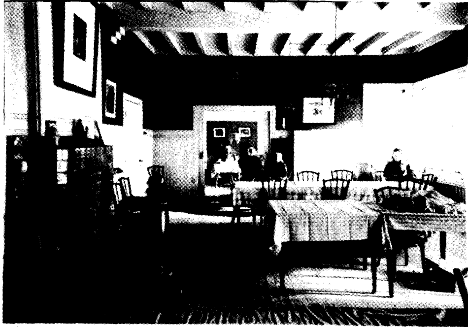
Recreatiezaal voor vrouwen

De met soda gereinigde grote en kleine weckflessen werden gevuld en met een witte doek afgedekt, daarna gesloten met twee op maat gemaakte plankjes en verzwaard met grote stenen. In de kelder stonden de rekken waarin de weckflessen werden bewaard.