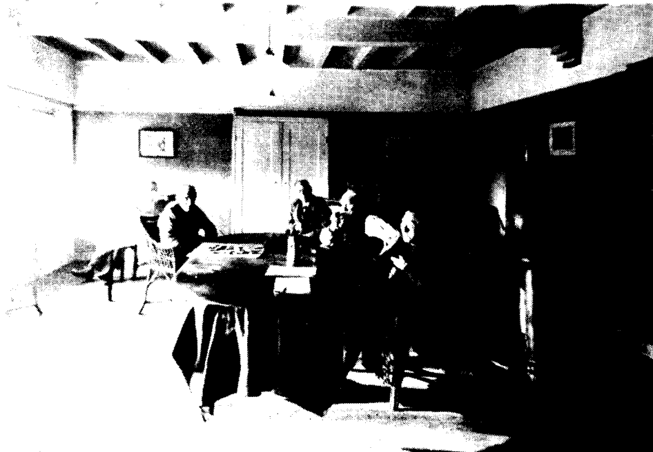
De recreatie-zaal voor mannen.

Met de feestdagen in zicht werden zij verrast met een extra sigaar. Hoe zij daaraan kwamen? Onderstaande brief geeft hierop antwoord.