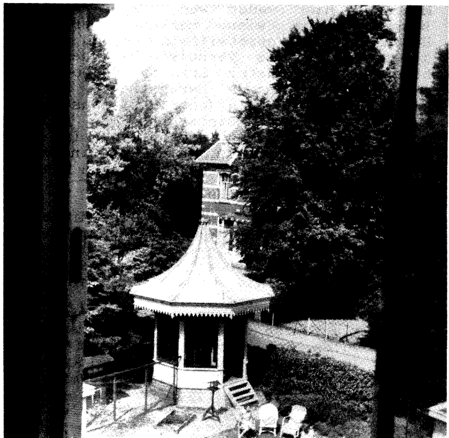
2. Het koepeltje in de tuin van Villa Quatre Bras