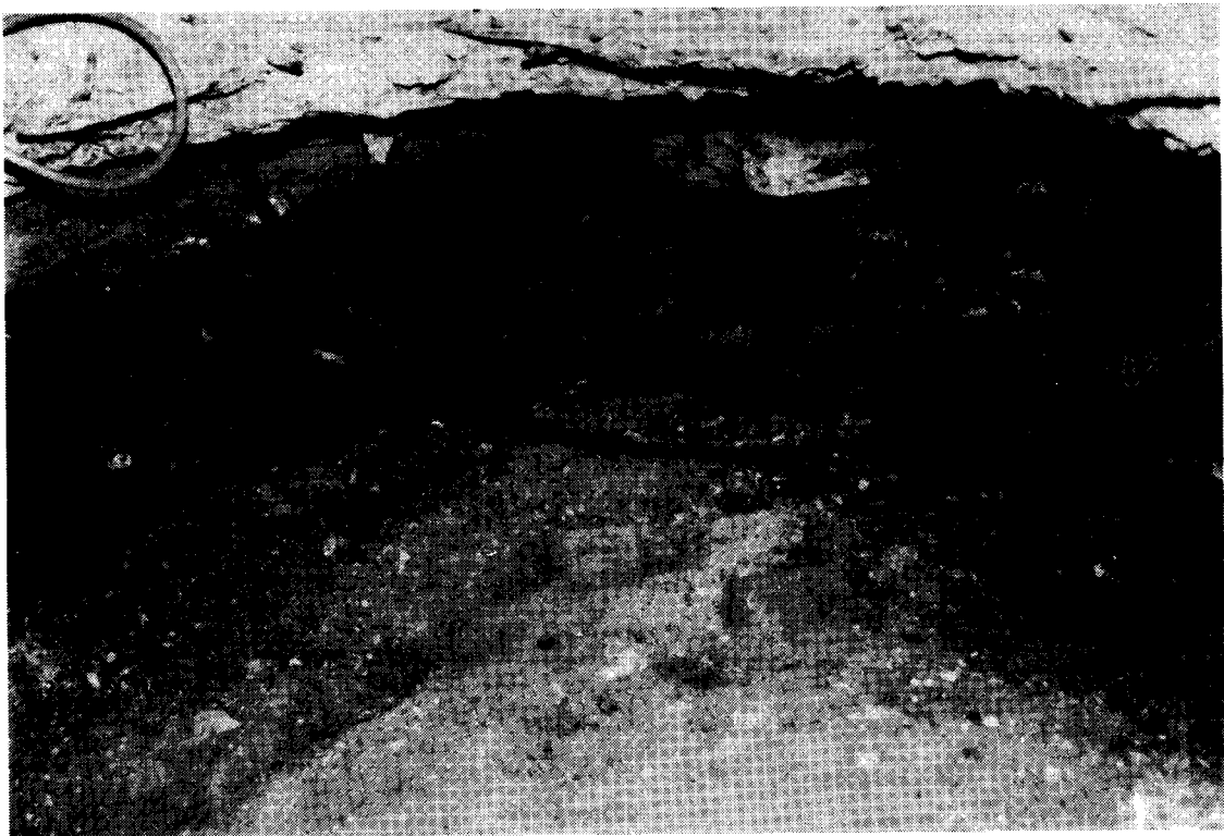
EEN STUK OEGRAVEN MUUR