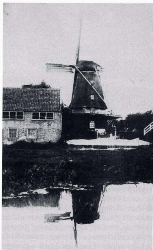
Foto 3: Op deze foto uit 1894 ziet men rechts de oude veebrug (wethoudersbrug).

Rond 1880 ging men er toe over Bussum te verdelen in wijken. De blekerij werd nu gemerkt als Wijk A nr 10. Later werd het weer gewijzigd in Brinklaan 10 en een paar jaar later vernummerd naar Brinklaan 35. In 1898 wordt de zanderijsloot achter de blekerij gedempt en midden op de Veerkamp wordt de Vaart van Naarden op Bussum aangelegd. De houten veebrug werd gesloopt en vervangen door de ijzeren Simon Hendrik Veerbrug. Deze lag ten opzichte van de houten veebrug meer in de richting van de Brink. Hierdoor moest het voetpad van de Veerbrug tussen de blekerij en de droogschuur doorlopen.