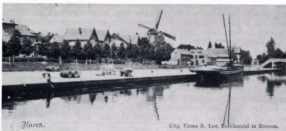
Foto 2: Op deze foto ziet men voor het woonhuis de grote droogschuur staan die in 1880 door IJzaak Ruijzendaal werd bijgebouwd.