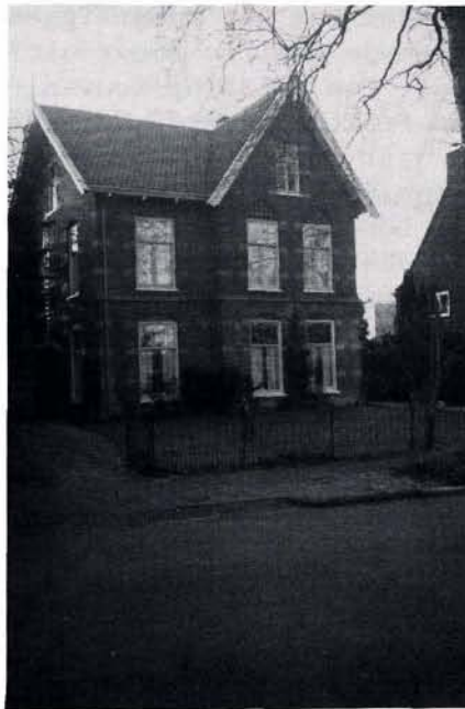
Singel 4 in 1992.

Singel 4 overleefde de oorlog zonder problemen. Het grote buurhuis nummer 2 van de familie Reinders werd in 1941 gesloopt en aannemer Fennis bouwde op het terrein twee aaneengesloten juweeltjes van woonhuizen: nummer 2 en 2a. In de eerste daarvan heeft dr. W.H.S. Fennis al jaren haar huis-artsenpraktijk. Wij kunnen met een gerust hart ziek worden; op minder dan 100 meter rondom ons vier artsen!