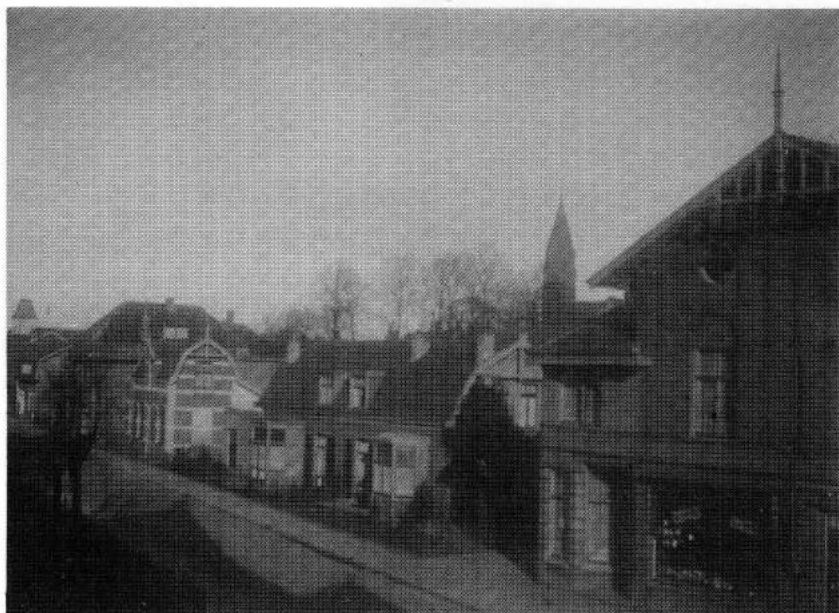
De kapelstraat gezien vanaf het broederhuis: rechts vooraan de schoenwinkel op nummer 55.

Op 21 augustus 1915 verscheen een advertentie waarin melding werd gemaakt van een opruiming wegens verplaatsing van de zaak naar de Kapelstraat; toen nummer 55. Volgens de Sinterklaas-advertentie van 1 december van dat jaar verkocht de familie Kort vele soorten schoenen en pantoffels, zelfs laarzen uit Sint Petersburg in Rusland.