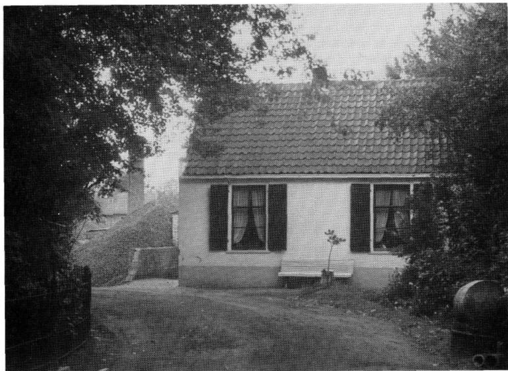
Foto: kolenopslagplaats Brinklaan 132 in augustus 1964. Rechts hiervan zijn later de rouwkamers gebouwd. Zie foto hieronder.