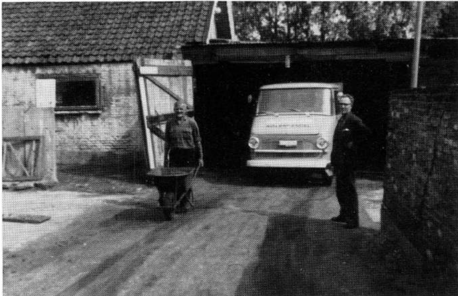
Foto: Brinklaan 132. Links Jan Eijer, rechts de broer van Gijs: Teunis de Jager. De vrachtauto is een Opel, type Blitz.

Ongeveer in 1962 werden de kolenopslagplaatsen en ook het kantoor aan de Cereslaan 79 opgeheven. Een nieuwe lokatie werd gevonden: aan de Brinklaan 132 werden een kolenopslagplaats en een kantoor gerealiseerd. Ten gevolge van de komst van het aardgas kwam in 1971 een definitief einde aan de in Bussum alom bekende kolenhandel van de familie De Jager "Djako".