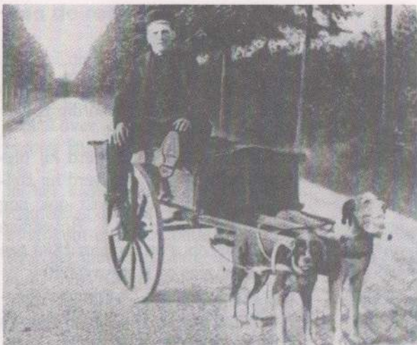
Foto van een hondekar.