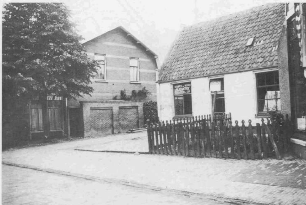
Afbeelding 4: de Kapelstraat in 1927 met links op nr. 15 het huis van Herman van Eijden. Rechts van de ingang van de Baaienrokkenbuurt op nr. 17 de vroegere bierbottelarij, die in zijn laatste jaren de stomerij/ververij Renovatrix van Rebel huisvestte.

In de Kapelstraat was op nummer 17 inmiddels een bierbottelarij (afb. 4) gekomen die aanvankelijk van Schreuder was en later door Ruijsseenaars werd overgenomen. Zij maakten daarbij handig gebruik van de bocht in de Baaien-