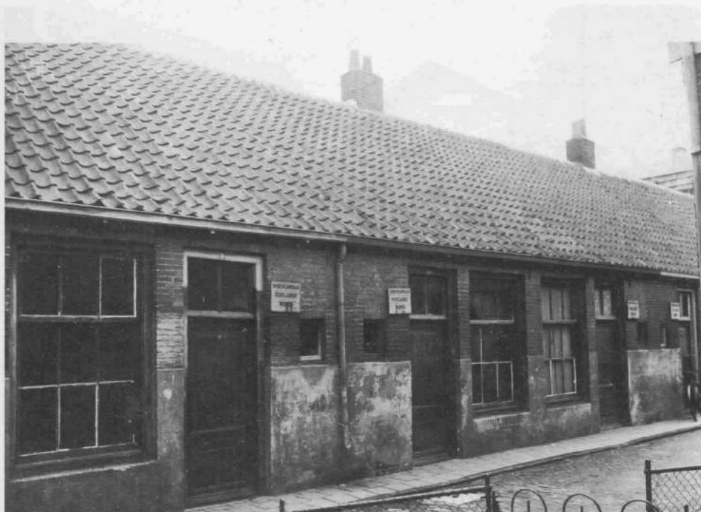
Afbeelding 3: het rijtje woningen nr. 9 t/m 19, nadat deze in 1929 onbewoonbaar verklaard waren.

In 1883 verkocht Gijs de Beer de strook grond, die in 1877 van perceel 201 was overgebleven, voor woningbouw. Aan de Kapelstraat zette men een villaatje, het latere nummer 19. Daarachter kwam aan de rechterkant van de Baaienrokkenbuurt een rij van zes arbeiderswoningen. Zoals de foto (afb. 3) laat zien, waren die gebouwd in de geest van die tijd en alleen van het uiterst noodzakelijke voorzien. Het straatje bezat toen negen woningen. Toen omstreeks 1900 de huisnummers per straat werden ingevoerd, gaf men het rijtje van zes de nummers 9 t/m 19 en de drie aan de overkant 21, 23 en 25. De huisnummers 27 en 29 werden gegeven aan het dubbele pandje aan de Landstraat op het eind van het straatje.