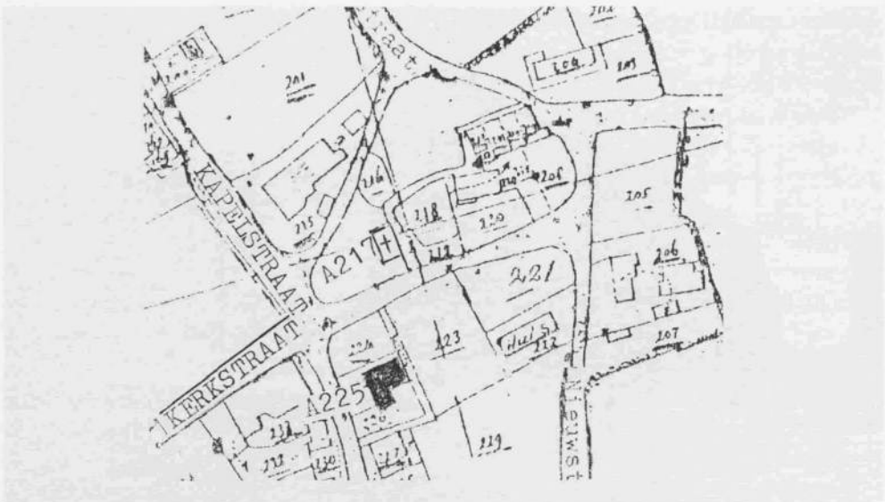
Gedeelte van de kadastrale kaart van 1824: de hoek Kapelstraat/Kerkstraat. Nummer A 217 is de Vituskapel en nummer A 225 de gemeenteschool