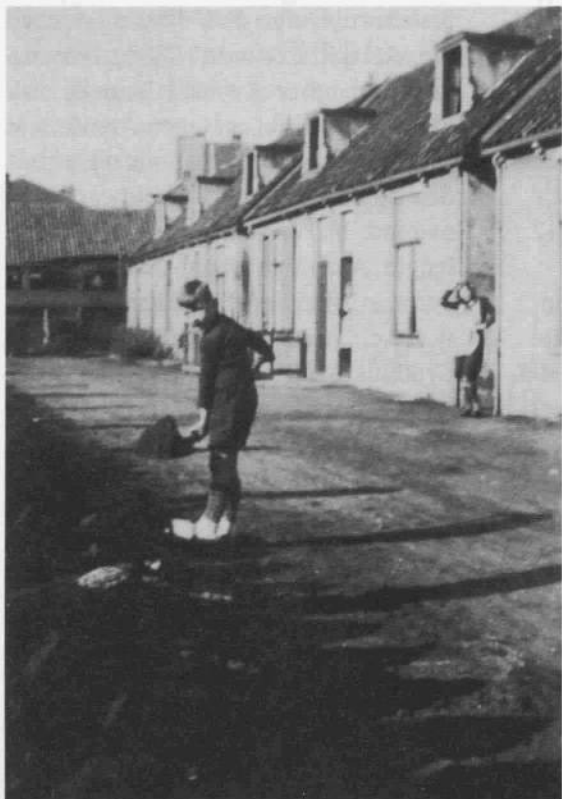
Afb. 3 (1959) v.l.n.r.: de woningen Veldweg 45 t/m 37.