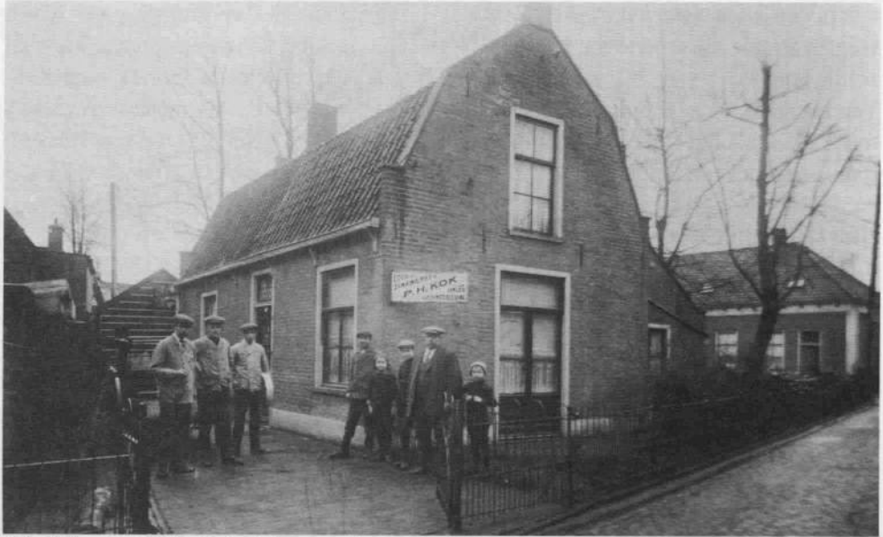
Afbeelding 6 (±1920): de loodgieterszaak van P.H. Kok, genummerd Veldweg 3. Rechts het blok Veldweg 7 t/m 13.

Deze boerderij blijkt in 1915 niet meer te bestaan. Het erbij behorende blokje van 4 woningen, zie ook de plattegrond op afb. 2, werd in 1893 bewoond door: nr. 82 (werd later nr. 7) W. Rakhorst, tuinman nr. 83 (werd later nr. 9) J. Hooijer, arbeider nr. 84 (werd later nr. 11) — nr. 85 (werd later nr. 13) J. Pelt, aanspreker