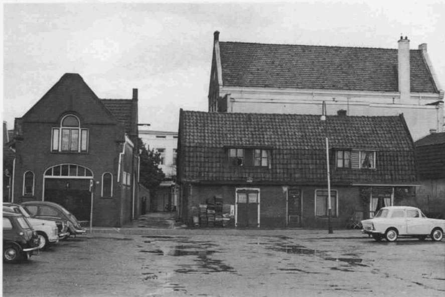
Afb. 8 (1965): v.l.n.r. Veldweg 14 en de woningen 12 en 10. Hierachter Veldweg 4 de drukkerij van Van Wetter & Co.

Door een wegenplan dat de gemeente in 1952 ontwierp, waren de nummers 31 t/m 45 gedoemd om te moeten verdwijnen, om de Vlietlaan te kunnen doortrekken naar de Herenstraat. Op dit vroege plan komen al een aantal rotondes voor, die thans, meer dan 45 jaar later, de een na de ander gerealiseerd worden.