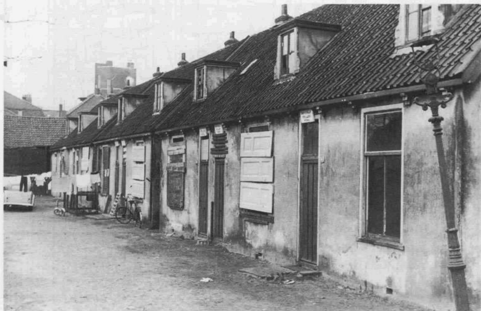
Afb. 4 (1960): de huisjes langs de spoorlijn, v.l.n.r. Veldweg 45 t/m 31.