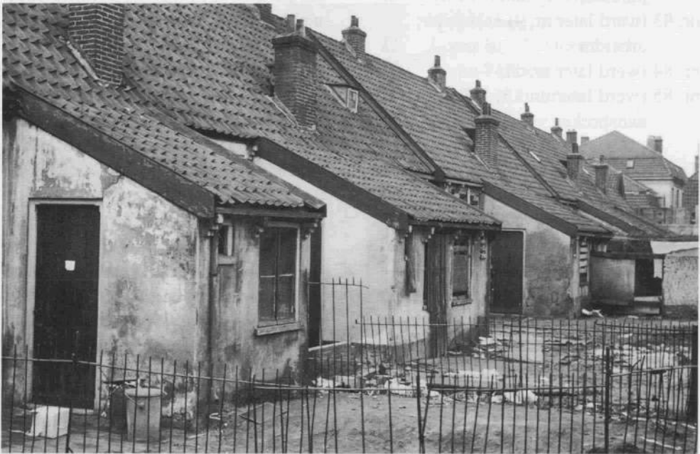
Afb. 5 (1960): de achterkant van de woningen Veldweg 31 t/m 45