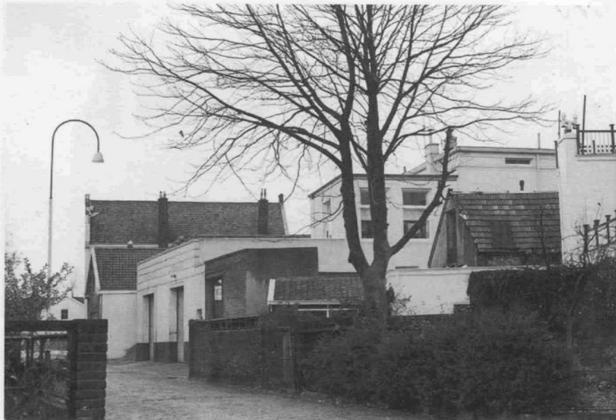
Afb. 7 (1964): de Veldweg met villa Nassau.