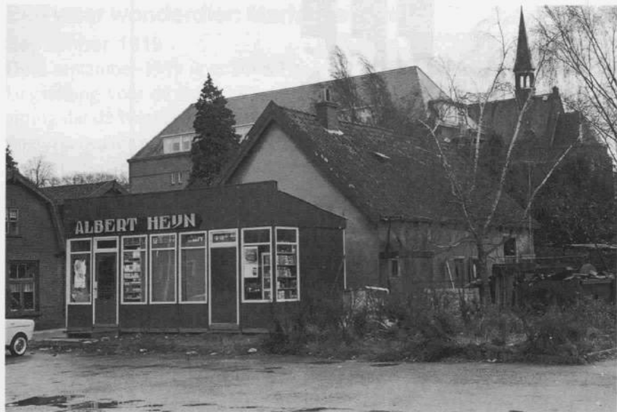
Afb.9 (1965): dit is het rechterdeel van afb. 8. Veldweg 15/17 achter een noodwinkel van Albert Heijn in verband met de verbouwing van het filiaal van A. Heijn op Nassaulaan 44.

spraakmakende branden in Bussum. De hele hoek moest volkomen gesloopt worden en er verrees een nieuwe speelgoedwinkel.