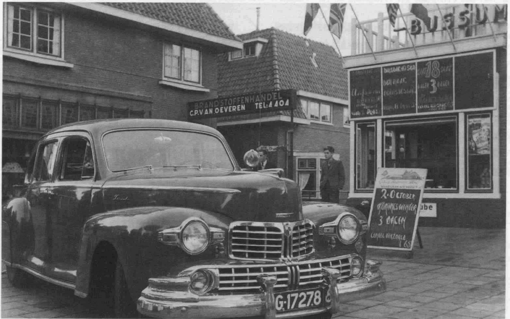
Foto: de slee, een Oldsmobile, die ook werd gebruikt als lesauto.