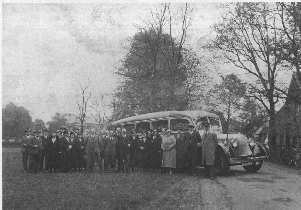
Foto (1933): presentatie van de Steward bus aan de Bussumse Middenstand. De foto is genomen bij de Kom van Biegel, rechts Hotel Beerestein, uiterst links is de vijver.

Op de foto kunt u zien dat de bus de letter G had, dat betekende dat hij uit Noord Holland kwam; vanaf 1952 werden de provinciale kentekens vervangen door landelijke. De B betekende dat er niet op B-wegen gereden mocht worden; op een B-weg mocht het voertuig