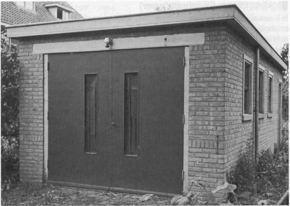
de hulppost aan de Graaf Florislaan.