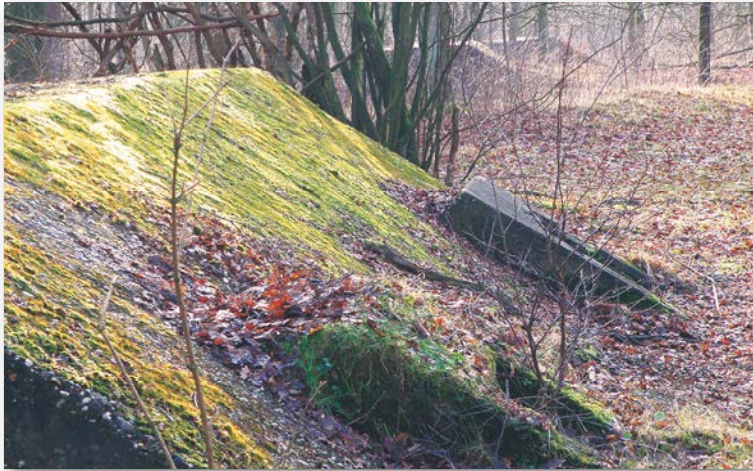
Drie van de tientallen betonnen onderkomens.

staat een artikel dat waarin de historie wordt beschreven van de tientallen geheimzinnige betonnen bouwsels die ooit in en rond de Fransche Kamp zijn gebouwd.