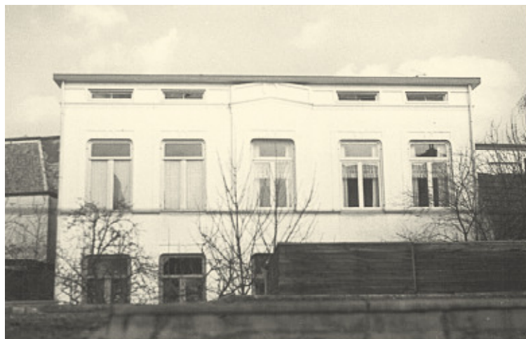
Oude villa Nassau in Bussum

Tekst: Jacques Poissonnier. Bron: Stads- en Streekarchief Naarden; De Bussumsche Courant; De Omroeper (1998); www.emaillebord.com .