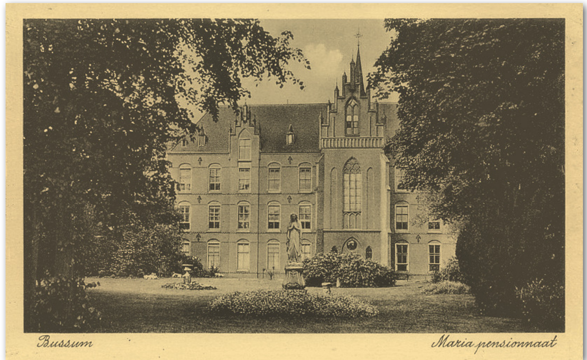
Marienburg omstreeks 1910

Na de bevrijding werd het klooster en pensionaat weer op dezelfde plaats voortgezet en volgde nog een bloeitijd die bekend staat als de nadagen van het Rijke Roomse Leven. Maar veel van wat er tot dan toe gewoon was, veranderde daarna in korte tijd