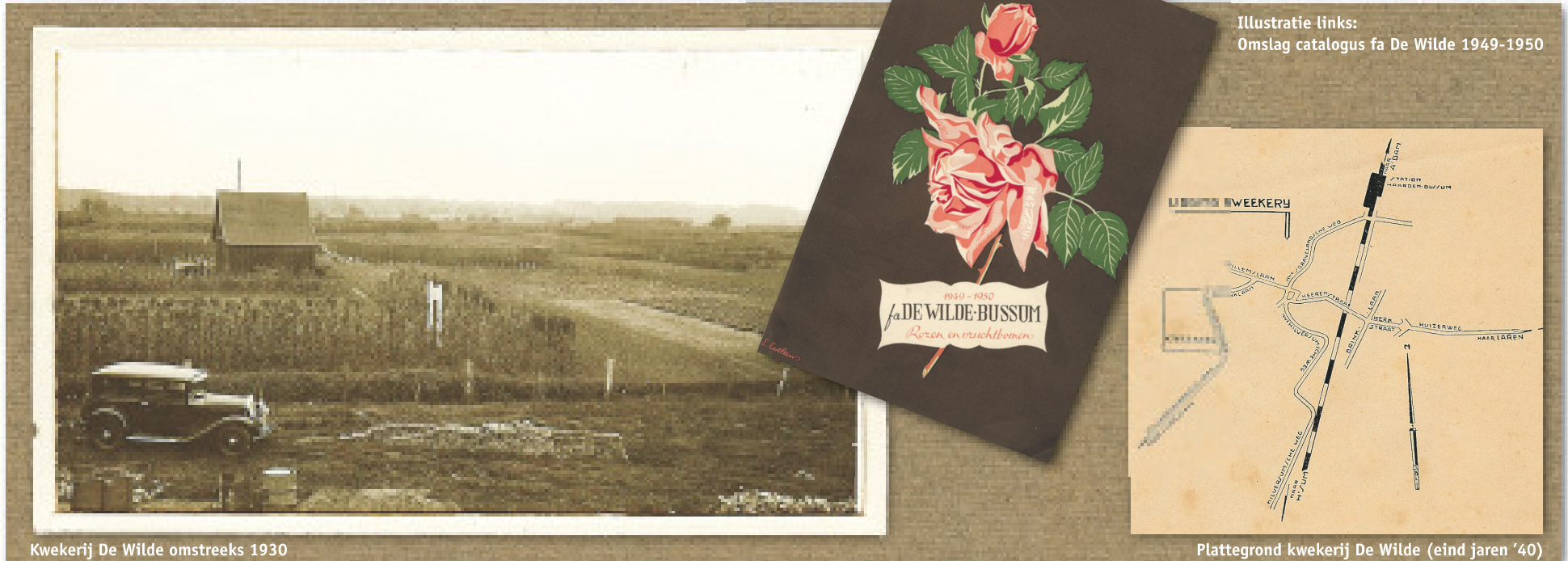
Kwekerij De Wilde omstreeks 1930