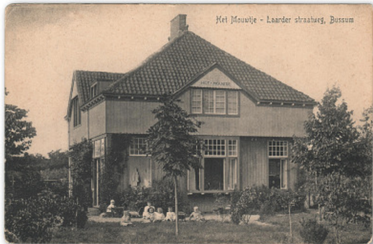
Villa Het Mouwtje omstreeks 1910