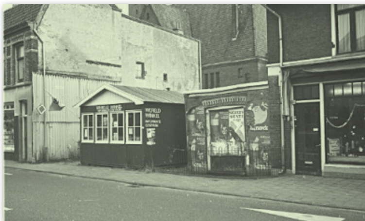
De wereldwinkelkiosk aan de Brinklaan, 1973, collectie M. Heyne

De mensen die actief waren in de plaatselijke alternatieve pers, eind jaren '60, stonden ook aan de wieg van de Wereldwinkel Bussum. Die ontstond in 1970 en kwam in 1971 tot volle ontplooiing. Er achter stond een groep kritische jongeren en leden van de r.k. kerk en protestantse kerken, die zich