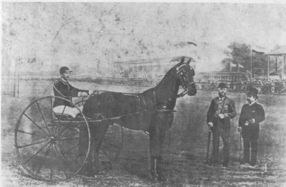
Afb. 2: op 3 september 1881 bezocht koning Willem III (met bolhoed) de wedrennen op de hei en liet zich rondleiden door burgemeester P. Langerhuizen (met hoge hoed). Op de achtergrond de tribunes.