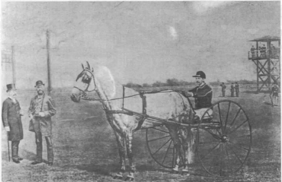
Afb. 3 (3 september 1881): de koning en de burgemeester op het middenterrein bij één der deelnemers. Geheel rechts is een van de jury-torens te zien.

Gebruikelijk was om een rijtuig te nemen, de Brinklaan af te rijden tot de overweg bij de R.K. begraafplaats, vervolgens een paar honderd meter de Bussummer Grintweg volgen tot een pad, halverwege waar later het terrein van de waterleiding kwam, dat leidde weer het spoor over, waarna dat pad met een grote boog naar de renbaan voerde. Met name voor mensen die van ver kwamen was de trein een oplossing. De Hollandsche IJzeren Spoorweg Mij. had een speciale halte gemaakt. Die was te vinden ter hoogte van de renbaan waar nu nog een oud spoorhuisje staat. Op de dag van de opening stopte hier en