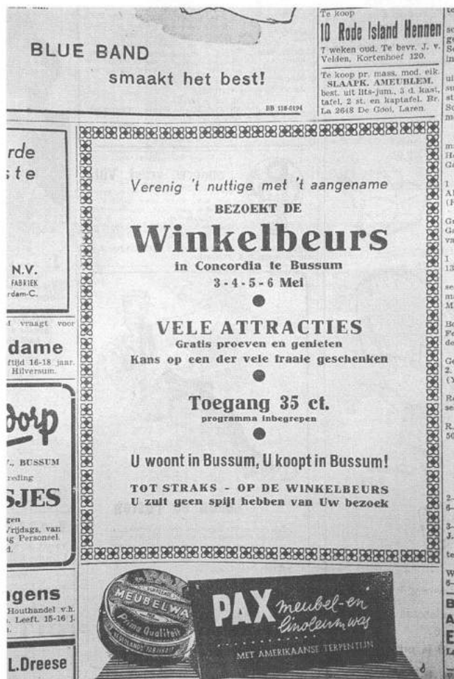
Een advertentie uit 1949 voor de winkelbeurs in Concordia.