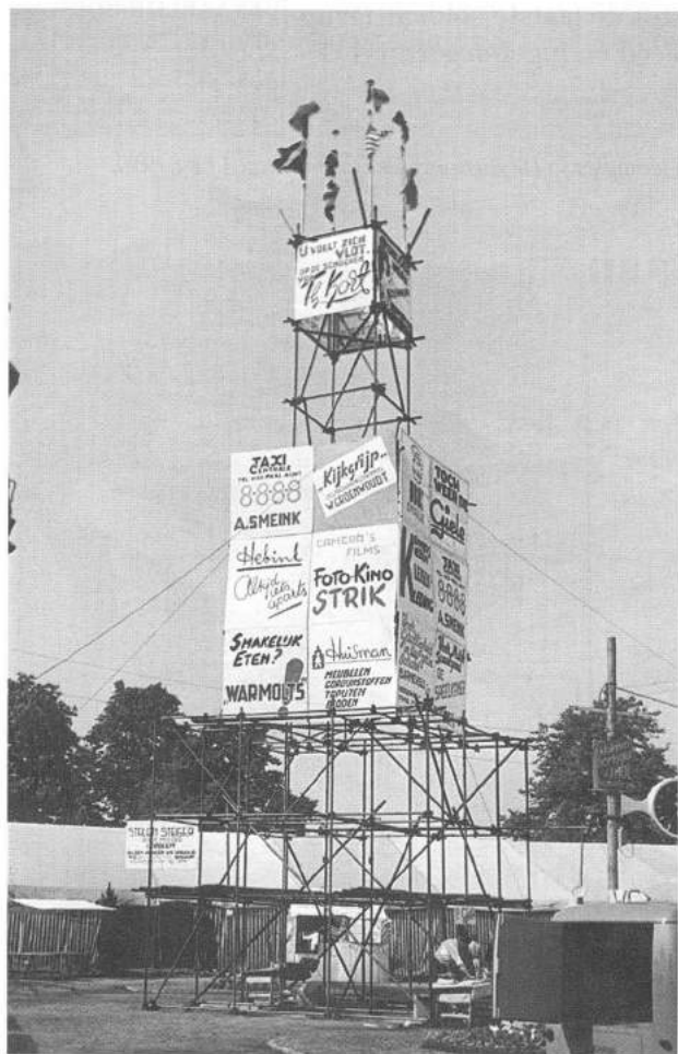
De reclamezuil bij de Buwito van 1950.

De Buwito van 1950 trok 20.000 mensen. Op het entreebiljet kon men een Buwitolepeltje winnen en diegene die raadde hoeveel bezoekers zaterdag om 6 uur de entree gepasseerd hadden kon een fiets of waardebonnen winnen. De toegangsprijzen waren voor de ochtend 10-12 uur 20 cent, 's middags en 's avonds 35 cent, kinderen en militairen 25 cent.