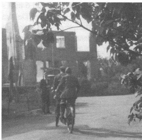
Fietsen op een tandem viel niet mee voor de Amerikaanse vrienden