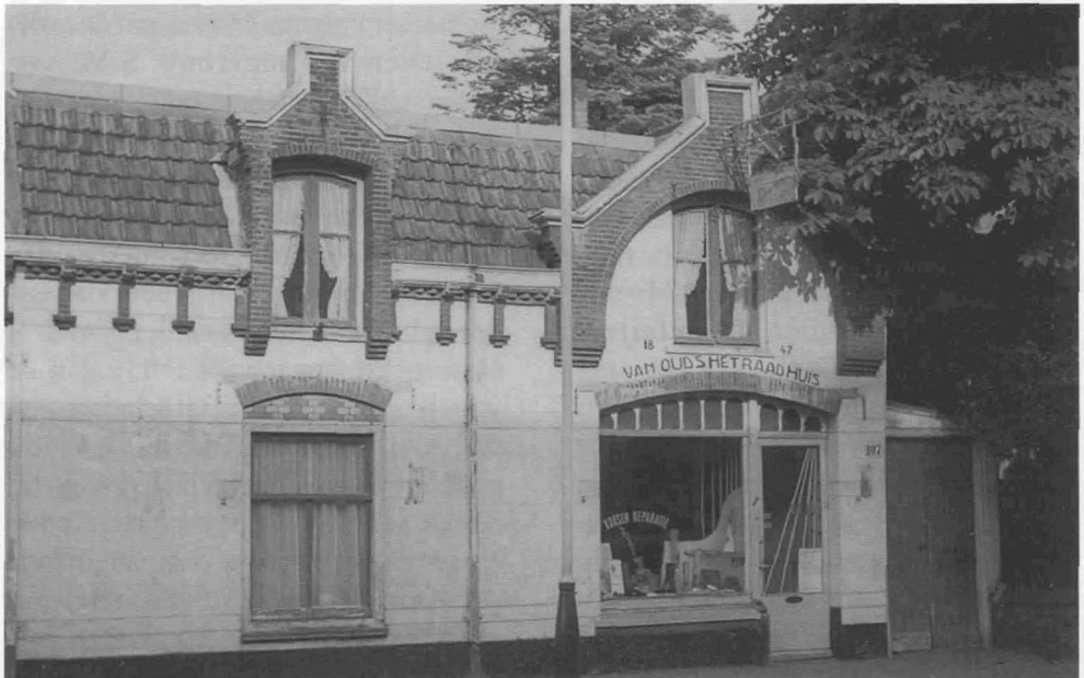
Het eerste raadhuis aan de Brinklaan

Tot 1845 was de raadszaal dus gevestigd in een kamer van de meesterswoning doch toen deze stierf was zijn opvolger niet genegen een kamer af te staan. Zodoende stelde de heer H. Kaarsgaren voor om een nieuw rechthuis te bouwen, wat bij een van zijn medeleden de vraag deed oprijzen of de kamer wel even groot zou worden als de vorige (niet minder dan 16 voet lang, 14 voet breed en 10 voet hoog). Men sprak toen nog over een