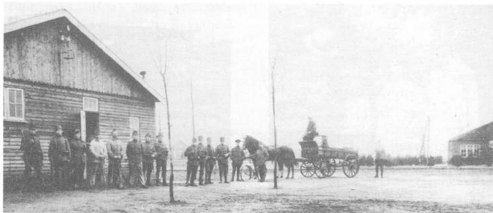
Kamp van Laren

Moordenaar – naar café Ruimzicht. Binnen bestelden de vaders een biertje en voor de moeders en de kinderen limonade, die op het terrasje werd gedronken uit een kogelflesje. Ondertussen konden de kinderen schommelen en wippen in het speeltuintje.