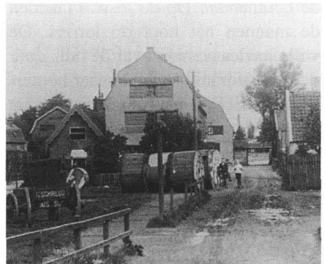
1925. De vaartweg ter hoogte van nr. 14/16 gezien richting Roemer Visscherlaan. Het huis rechts werd 1925/1926 gesloopt