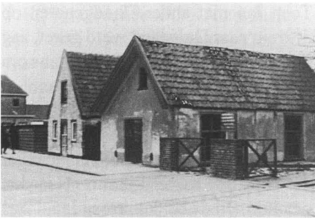
9 april 1935. De rails in de vaartweg ter hoogte van de nrs 14/16