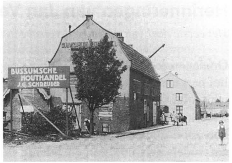
31 juli 1931. Vaartweg ter hoogte van nrs 5 t/m 7a. Gebouw van de bouwmaterialenhandel gesloopt in 1931.