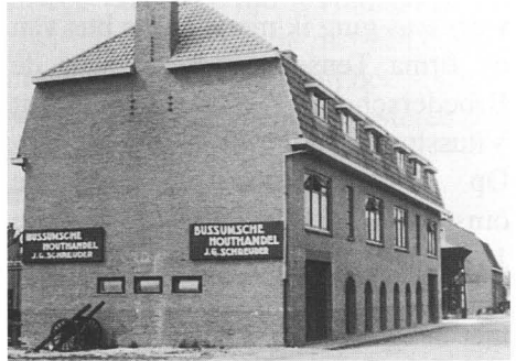
21 juni 1932. Vaartweg ter hoogte van de nrs. 5 t/m 7a