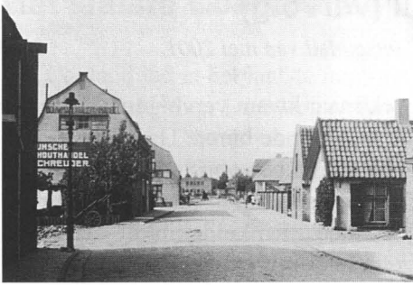
1928. Vaartweg ter hoogte van nrs. 1 t/m 7a.