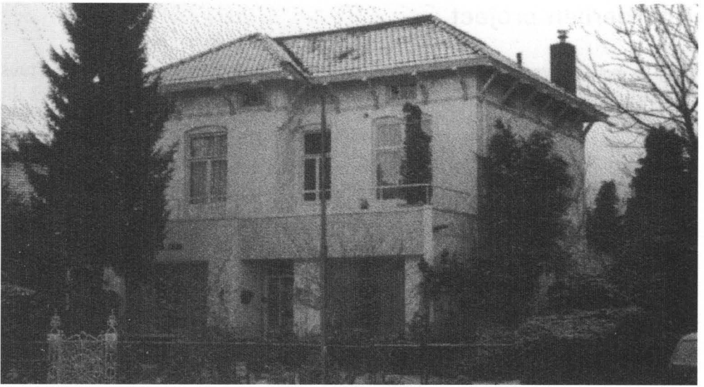
Koningslaan 12 tegenwoordig.

maar moesten tot de formele overdracht op 2 juni 1986 wachten voor we er in konden trekken. We wonen er nog steeds met groot genoegen. Ook genieten we van de mooie tuin erbij.