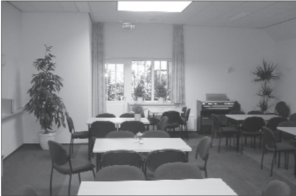
5. De Ds. Hoekendijk-zaal in de nieuwe aanbouw van het VEG-kerkgebouw te Bussum.