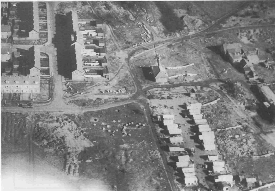
3. Op de luchtfoto van ca. 1950 is de positie van De Kaap ten opzichte van de Laarderweg goed te zien. Links de Ruysstraat, in het midden het schoollokaaltje.