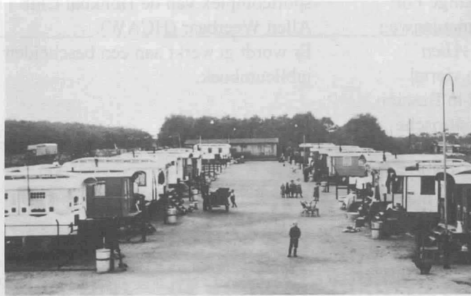
2. Het woonwagenkamp op de plek van De Kaap, gezien vanaf de Laarderweg naar de spoorlijn.