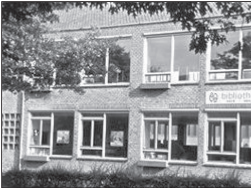
Filiaal Uit-Wijk aan de Ceintuurbaan 47 A. te Bussum.