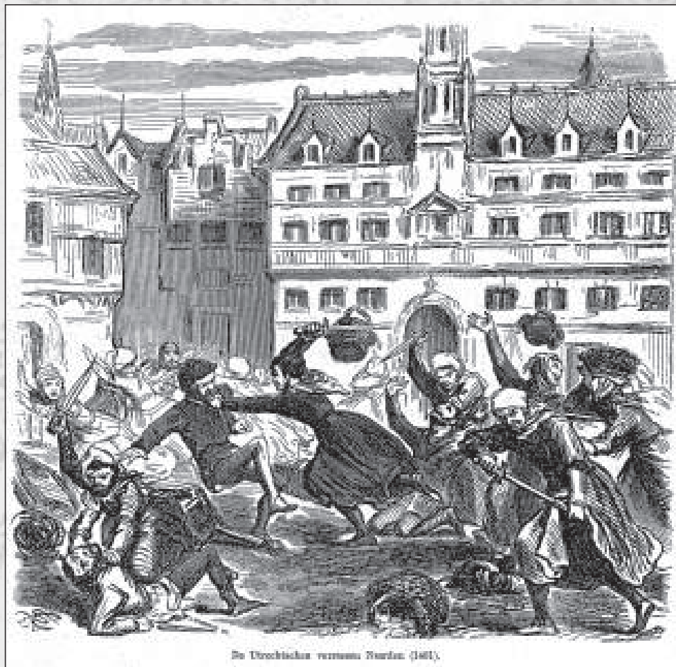
De Utrechtsche verovering Naarden (1611).

Aan deze bestuurlijk lastige situatie maakte de graaf in 1396 een einde door het grondgebied van Muiderberg te verdelen tussen Muiden en