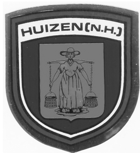
Het melkmeisje op het Wapen van de gemeente Huizen

Een prachtig voorbeeld is het Gemeentewapen van Huizen. Dit Wapen werd in 1816 geregistreerd en toont een melkmeisje met twee emmers aan een juk. Vroeger was men van mening dat vervoer van melk in emmers met juk de kwaliteit van de melk ten goede kwam. Vooral als men van de melk kaas wilde maken.