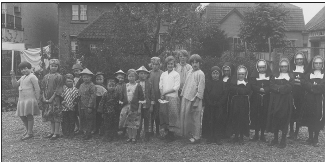
Foto 1: Jongens en meisjes als Chinees verkleed met rechts de zusters

Als een meisje als Bruidje meeliep, kostte dat niets; die kleding had ze meestal al van de Eerste H. Communie of omdat ze reeds eerder had