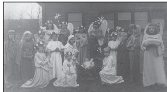
Kerstspel bij het schooltje in het kamp

In januari van dat jaar was men ook begonnen met "een verenigingsgebouw voor woonwagenliefdewerk op het terrein. De eerwaarde broeders zullen hier gaan lesgeven". Op 24 mei 1934 werd het gebouw feestelijk geopend. De krant benadrukt: "Het is wel een zeer moeilijke jeugd die hier te leiden en te onderwijzen is". De broeders van de R.K. Vereniging van Woonwagenliefdewerken in Nederland waren wel wat gewend. "Alle bewoners kregen bij deze gelegenheid een extra bon voor winkelboodschappen, terwijl de kinderen een versnapering ontvingen" Het schooltje heeft een plaats verworven op het kamp. Op een oude foto zijn de kinderen uit het kamp te zien, die meededen aan het Kerstspel naast dit houten gebouw.