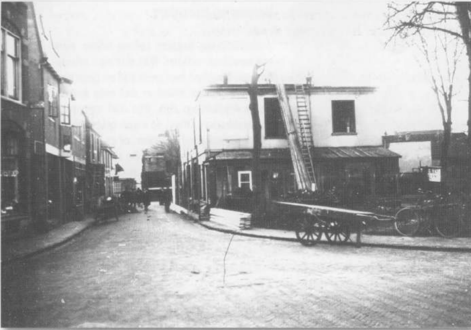
afb. 38 Inrij van de Havenstraat vanuit de Landstraat in 1929. Het dubbele woonhuis dat bij de scheepsbeschuitfabriek hoorde wordt afgebroken. Daardoor kwam er ruimte vrij om de straat te verbreden.

De woningen van 'kleine luiden' hadden in het gunstigste geval een gemeenschappelijke pomp. Omdat voor het slaan van een pomp een waterader gezocht moest worden stond de pomp meestal buitenshuis. Om bevrozing te voorkomen, werd de pomp in de winter maanden in een gedorste korenschoof ingepakt. Er waren ook gezinnen die van slootwater van de afgravingsloten gebruik maakten.