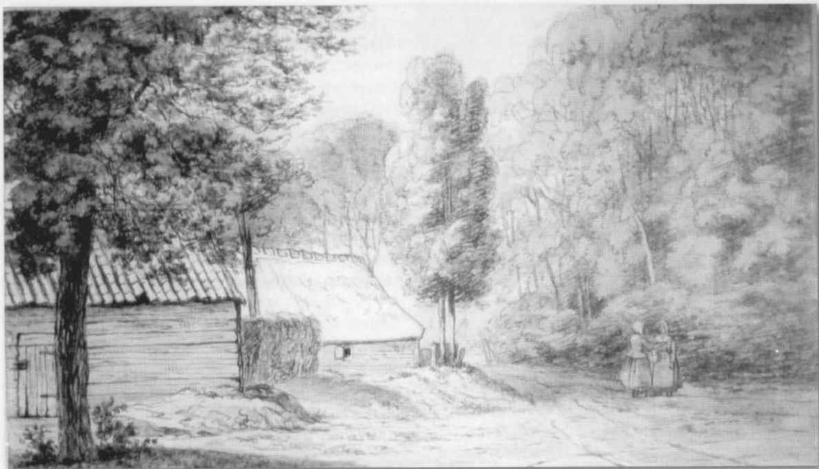
afb. 33 De Prinsenstraat omstreeks 1855, gezien vanaf de Brinklaan. Door H.A. Klinkhamer.