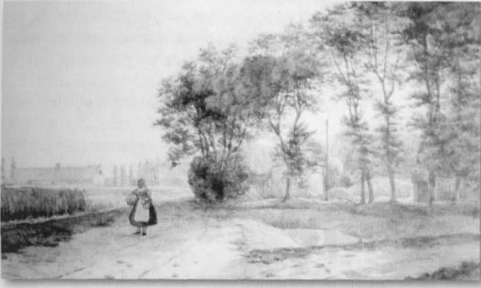
afb. 37 De Spiegelstraat, gezien vanaf de hoek met de Meentweg, omstreeks 1855. Door Klinkhamer geschilderd. Op de achtergrond zien we de Herenstraat, over de akkers, die nog niet door de spoorlijn worden doorsneden.