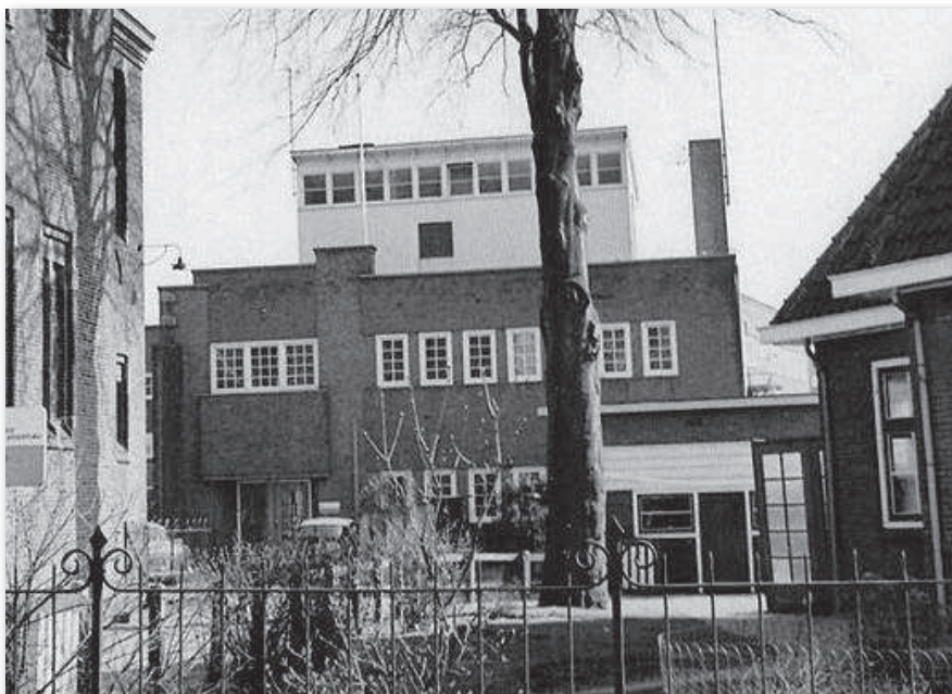
Boven: gebouw Eltheto voor ingebruikname door de NTS Onder: ... en na de verbouwing