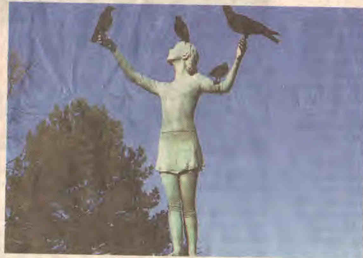
Kraaien zijn onderdeel van het kunstwerk in Bussum.

'Nu stond de klok onder in de toren', vervolgt Poolman. 'Hoe moest men dit gevaarte van 468 pond in de toren krijgen?' Omstanders riepen: 'Gewoon met een lang sterk touw en dan maar hijsen.' Ja, ja, maar als dit