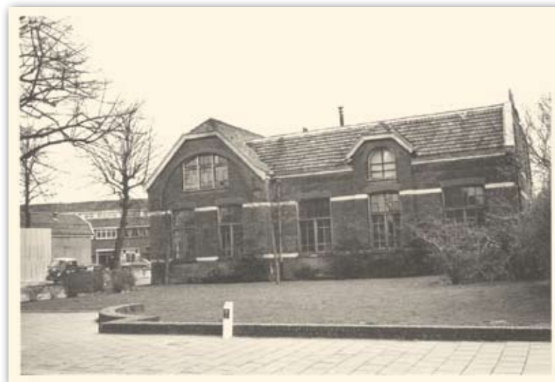
Teekenschool (zijkant) gezien vanaf de straat voorlangs Irene-MULO

ren, allen door de gemeenteraad te benoemen. Met dit aantal wordt in 1902 gestart. In 1905 is het team uitgebreid met een assistent-onderwijzer, in 1912 staan er vijf leerkrachten op de begroting. De school maakt een voorspoedige ontwikkeling door. Vanaf de oprichting tot