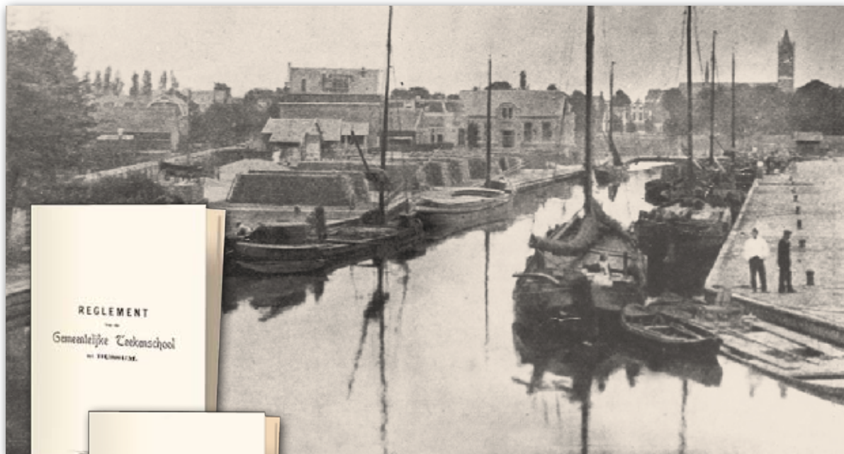
Teekenschool (vooraanzicht), gebouw in het midden, achter de haven - foto Coll. HKB.

Om toegelaten te worden dient de leerling de lagere school geheel afgemaakt te hebben. Later kan ook aan de lessen worden deelgenomen na een examen. Uit een advertentie uit 1904 blijkt dat een van de tekenleraren een opleiding voor het toelatingsexamen verzorgt. Het eerste reglement voorziet in een lesgevende directeur en minstens twee lera-